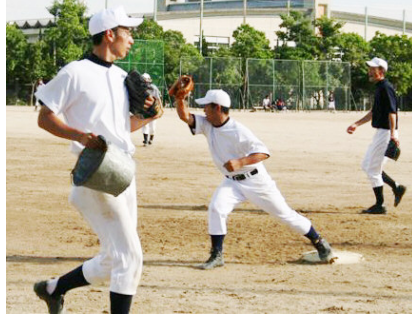
練習もキビキビはつらつプレー!!

今年の大会テーマ「甲子園に恋をした」。今年もドラマチックな熱い、高校生らしいプレーに期待して、早速、地元南陽高校野球部にお邪魔してきました。