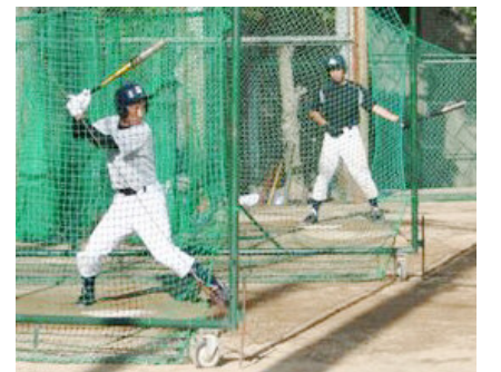
京都大会へ向け、好球必打!!

練習を見ている元気はつらつプレーはいい感じ。マネージャーも含めた野球部全員が一丸となって、夏の大会にいどむ気持ちが大粒の汗といっしょに伝わってきた取材でした。今年もベストを尽くして勝ち進んでほしいですね。南陽高校の選手のみなさん、がんばってください!! 今年も応援にまいります!! (木本)