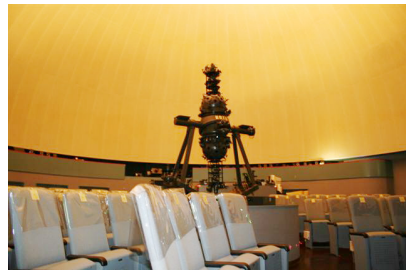
●星空をながめ、夢心地...

木津から州見台~梅美台~梅谷を抜け加茂町方面へ。ほどなく「浄瑠璃寺交差点」に差し掛かるのでここを右折。道なりにいくと小さな看板が見えてきます。(写真) 無料駐車場の奥には、「UFO?」を思わせるような建物が建っていて、なんだかこれから宇宙へ招待されるようなワクワク感でいっぱいです^^。