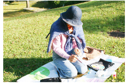
秋の樹木の彩りがいっぱい...