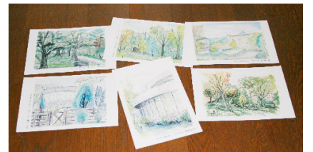
秋の香りいっぱいのポストカードが出来ました!