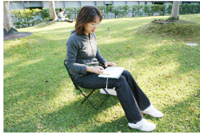
垣根越しの風景にペンが走る...

では、当日の楽しいスケッチ風景のヒトコマをご紹介します。木津川市兜台6丁目、積水ハウス株式会社総合住宅研究所内にある、四季折々の自然が感じられる葉膳レストラン「あわさい」さんにお邪魔して、それぞれが◎ お気に入りのスケッチポイント 探しです。おおよその場所が決まれば、何を描きたいのかという気持ちと印象を大切に、◎ 画面に構図を検討 してみます。「こんなところかな?」と気持ちが落ち着いたら、さあ、◎ スケッチのスタート です。描き方や道具の使い方は自由です。もちろんモチーフ選びも自由で、何の制約もなければ決まりこともありません。思いのままに、自分が納得できるように、存分にスケッチをたのしみましょう。◎ 描きたいところが画面に収まるように、大まかなアタリ をつけます。