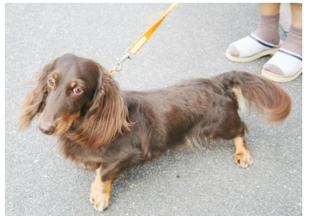
チョコ(4才)ミニチュアダックス 人が好き、犬嫌い!! 加茂町駅東/志野さま