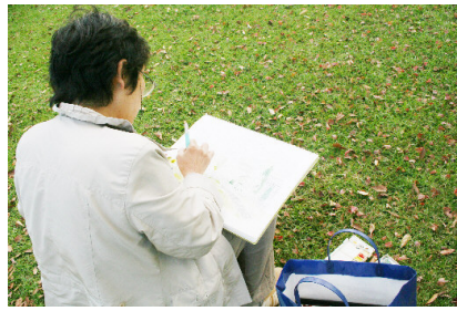
素敵なテラスに着彩...

およそ2時間のスケッチでは、紙の大きさは、F4サイズ以内(個人差あり)が適しています。スケッチから着彩まで、自分の描くペース配分を考えて、紙の大きさを決めると、時間に応じて作品の完成度も高まり、満足感も味わえると思います。