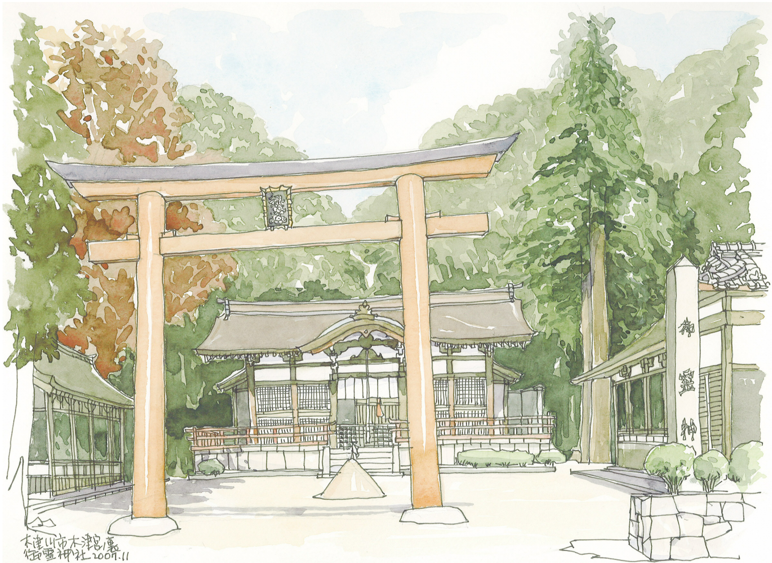
木津川市木津島裏 御霊神社 2007.11