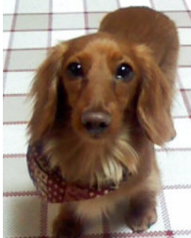
リヤン(2オ・Mダックス)↓

「リヤン」はおとなしくて優しい子です。おてんば娘の「アムル」の良いお姉ちゃんです。「アムル」は体がとても小さいですが、態度はとても大きな子です。(笑) いつも2匹で仲良く遊んでいます。いつまでも元気で家族のかわいい天使でいてほしいですね!