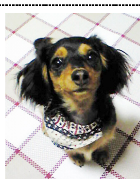
アムル(1オ・Mダックス)↑