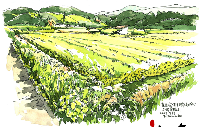
ふるさとニノジヤム山城を訪れた帰路、国道163号線を上りへ逸れた。以前に描いた高麗寺跡あたりの田園は、いま刈り取り前の稲穂が頭を垂れています。夏の緑ひと色から一気に染まるゆたかな色彩。流れる白い雲に足早の秋、到来。 takei kazuhiko