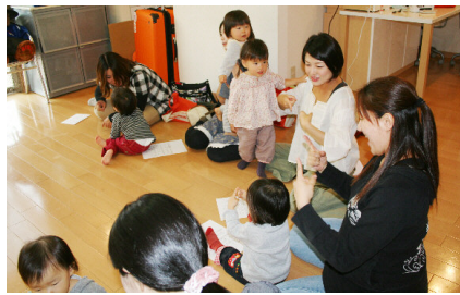
ママもいっしょにねっ♪

取材日は修了式と最終レッスン。「おさらい」を中心に楽しいレッスンが始まりました。テキストを使ったテーマごとのサインのレッスン。絵本の読み聞かせでは、やはりサインを重視した小気味よいスピードに幼児たちの顔は楽しさで満面に笑顔たたえています。音楽、リズム体操などが織り交ぜられ、幼児の集中力がこんなにも持続できることに、少し驚きも感じたくらいでした。