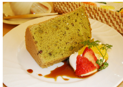
小豆入り抹茶シフォンケーキは絶品でした♪