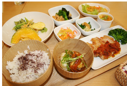
日替わりランチは元気な野菜がいっぱい(100%自家製)

100%で、季節に応じて旬の野菜がランチの主演となっています。この日のランチは、豚肩ロースのトマト煮込み、揚げ出し豆腐、野菜の天ぷら、えびと野菜のマリネ、煮物、ねぎとお揚げの酢味噌、茶碗蒸し、サラダ、ごはん等、種類の多さにびっくり♪(ランチ¥1,050、+飲み物¥1,200)