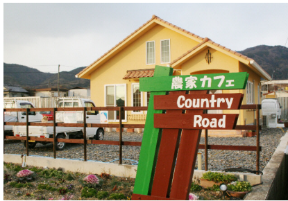
春が楽しみなお店のまわりはお花畑♪

2010年第1弾のASA探検隊は、「農家カフェ」という名前に思わず田園風景を思い浮かべてお邪魔した、加茂町のランチとスイーツのお店「カントリーロード」さん。