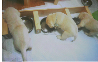
待ちに待ったお食事タイム♪