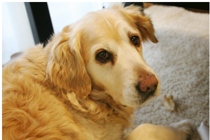
優しいお兄さん役のユース(9歳オス)

街で視覚障がい者の方と盲導犬が寄り添うように一緒に歩いている優しい光景を見ると心が温かくなります。予期せぬことで視力を失った人の安全を確保しながら、目的地へ確実に誘導する盲導犬たち。誕生から訓練、そして盲導犬へ。ボランティアの温かな心に包まれた環境をたくさん教えて頂きました。