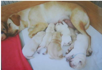
ボクはもうお腹いっぱい …ZZZ…

くなり、元気に動き回るようになります。仔犬の成長は驚くほど早く、3週目に入るともう離乳食の始まりです。この頃から俄然、ボランティアさんのお世話が忙しくなり、初めはお湯でふやかしたドッグフードを指に乗せ、すこしずつ食べさせたり、排便排尿のチェックや体重測定など細々としたお世話の毎日が過ぎていきます。こうして生まれた当初の約300gの体重はおよそ2ヶ月で4~5kg程度になり、驚くほどの成長ぶりを示します。