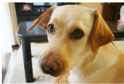
繁殖犬のキオラ(5歳メス)はいつも快活!

キオラちゃんのような母犬を預かる繁殖犬ボランティアさん(ブリーディングウォーカー)は、母犬の妊娠・出産のお手伝い始まり、生まれてから約2ヶ月間、仔犬のお世話をします。生まれたばかりの仔犬は、片手に乗るほどの小さな体で、まだ目も開いてはいません。ボランティアさんは、母犬が仔犬たちにお乳をあげたり、おしっこや排便のお世話をしてくれるのを見守ります。2週間を過ぎると、仔犬たちも一気に大き