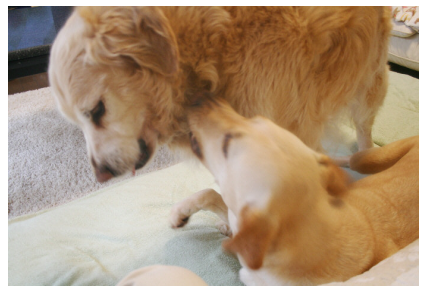
遊ぼうよ♪ おねだりはいつもキオラ…

こうしてお話を伺うと盲導犬ボランティアの分野もいくつもあることがわかりました。①ブリーディングウォーカー(繁殖) ②パピーウォーカー(仔犬飼育) ③キャリアチェンジ犬の引取・飼育 ④リタイア犬の引取・飼育。その他、盲導犬用の服の縫製等、本当に多くのボランティアさんの温かな支援でつながっています。盲導犬になるための過程で、それぞれのボランティアさんの温かな愛情を注がれ、